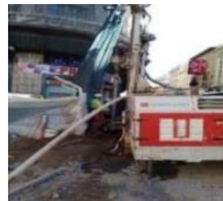
Accés Argenteria. Micropilots zona escales en execució