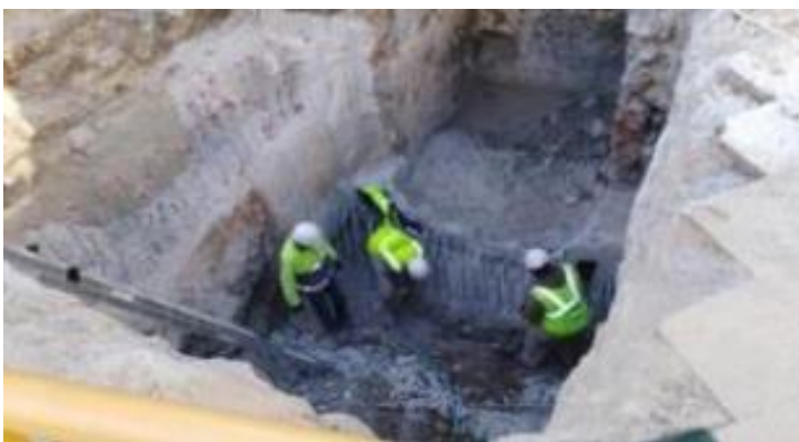
Plaça de l'Àngel. Pantalles formigonades

Accés Argenteria. Micropilons zona escales en execució a data 1 de desembre de 2017